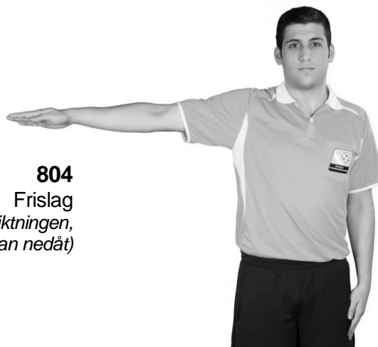
804 Frislag (armen vågrätt i fördelsriktningen, handflatan nedåt)