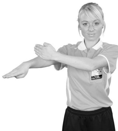
901 Otillåtet slag (ett slag med handen)