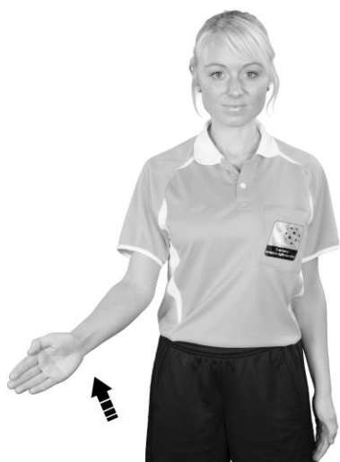
920 Hands (handflatan snett uppåt)