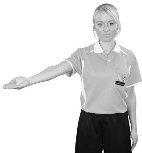
805 Fördel (armen i fördelsriktningen, handflatan snett uppåt in mot planen)