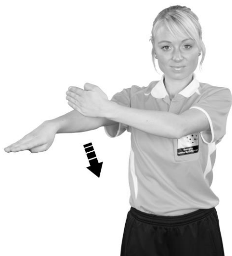
902 Låsning av klubba (handflatan nedåt)