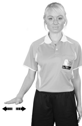
919 Liggande spel (handflatan nedåt)