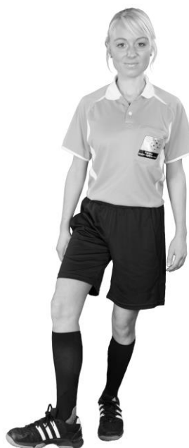
912 Otillåten spark (foten i vristhöjd, vriden utåt)