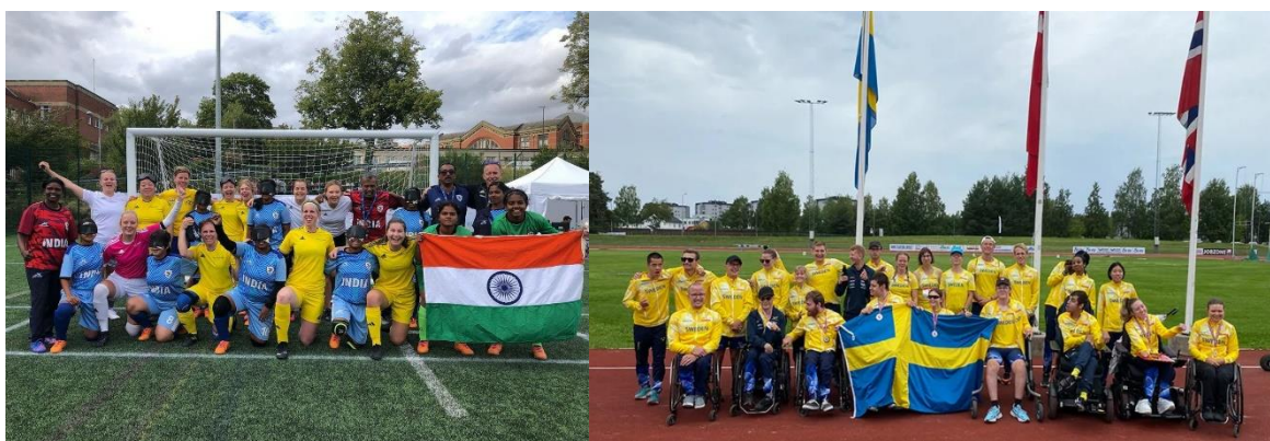
Bild ifrån VM i fotboll 5 a side Birmingham. Para-NM i Norge.

Med glädje kan man konstatera att friidrottare, fotbollsspelare, bordtennisspelare, längdskidåkning och rullstolsrugbyspelare har varit ute i världen. Ifrån IFK Västerås, RBU Västerås, Västerås Friidrottsklubb, Västerås BTK, Västerås Skidklubb och Köpings IK.